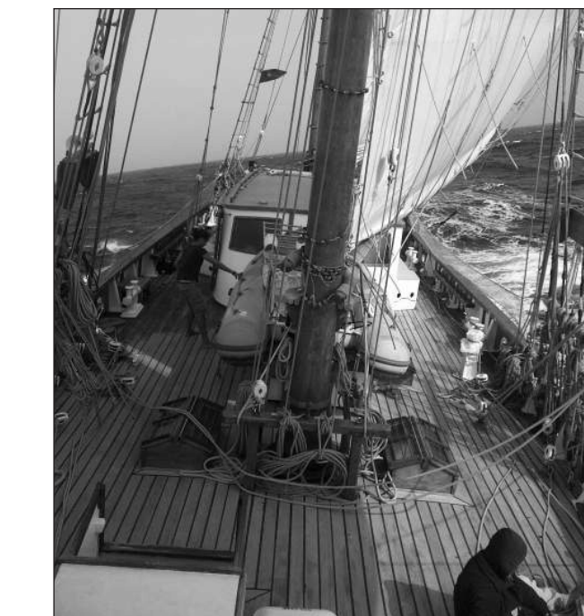
Entre les Canaries et le Cap-Vert, le 20 décembre 2013. A bord du «Fleur de Passion», les jeunes équipiers partent à la découverte du grand large, mais aussi des autres et de soi-même.

C'est toute une vie en communauté qui doit s'organiser, les règles explicites ou tacites qui doivent trouver à s'imposer auprès des jeunes. Loin de devoir se «recentrer» sur eux-mêmes, c'est plus dans la relation à l'autre que se situe clairement l'enjeu. Et si les contacts initiaux peuvent paraître rugueux avec les adultes, empreints d'une forme de défiance générale, les liens progressivement se tissent dans une acceptation réciproque. Pour les adultes, ce que les jeunes ont fait qui leur vaut d'être à bord importe peu, voire pas. «Seul importe la capacité à porter sur eux un regard départi de tout jugement et qui