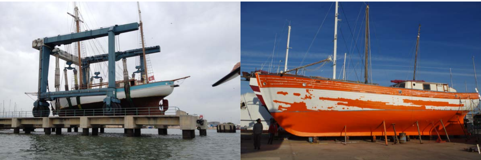
La sortie de l'eau en octobre à Portimao, puis les travaux sur la coque après la dépose des mâts.