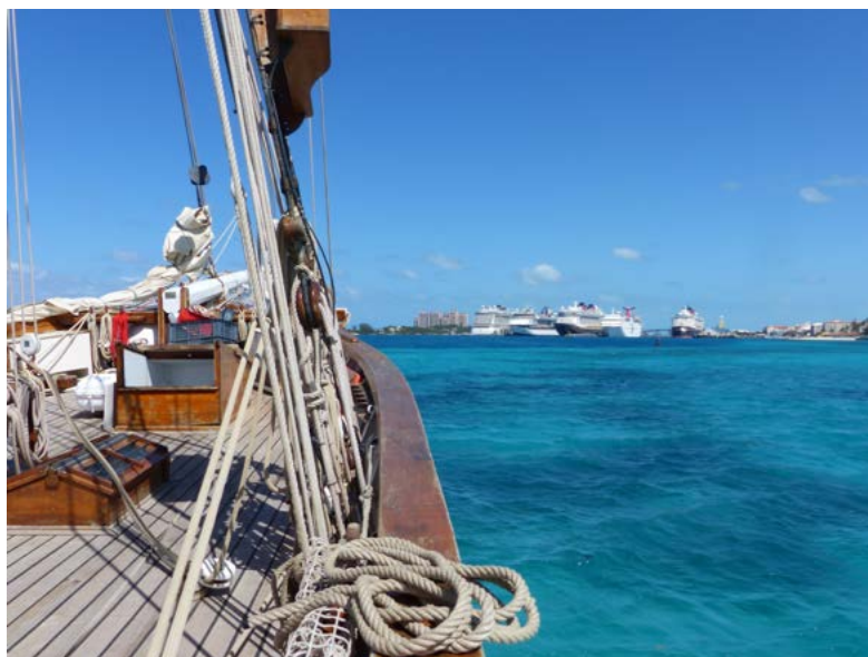
Arrivée de Fleur de Passion à Nassau, aux Bahamas.